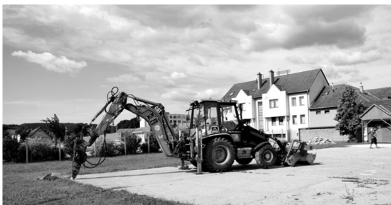
Piac építési munkái kezdődnek a terület előkészítésével