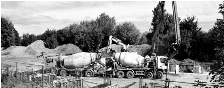
Nagy ütemben készül a tanuszoda alapozása