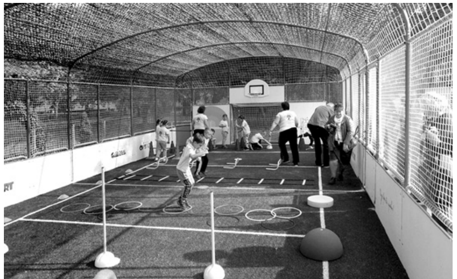
A Rétszágon épülő óvodai sportpálya (Típusterv alapján másutt elkészült pályáról fotó)

■ Ötödikként a volt honvédségi „vezetési pálya” (32 ha építésre szánt terület) gaz és bozótirtására érkezett árajánlatok szerepeltek a napirenden. A PVB ülés összefoglalójaként elhangzott, hogy 3 árajánlat érkezett be. Bizottsági ülésen több vélemény fogalmazódott meg azzal kapcsolatban, hogy jelen időszakban szükséges-e ennek a munkának az elvégzése, mert időben még nem aktuális. Az építési telkek kialakításához még sok feltételt kell teljesíteni, így addig rövid időn belül ugyanilyen gazos lesz a terület. Más