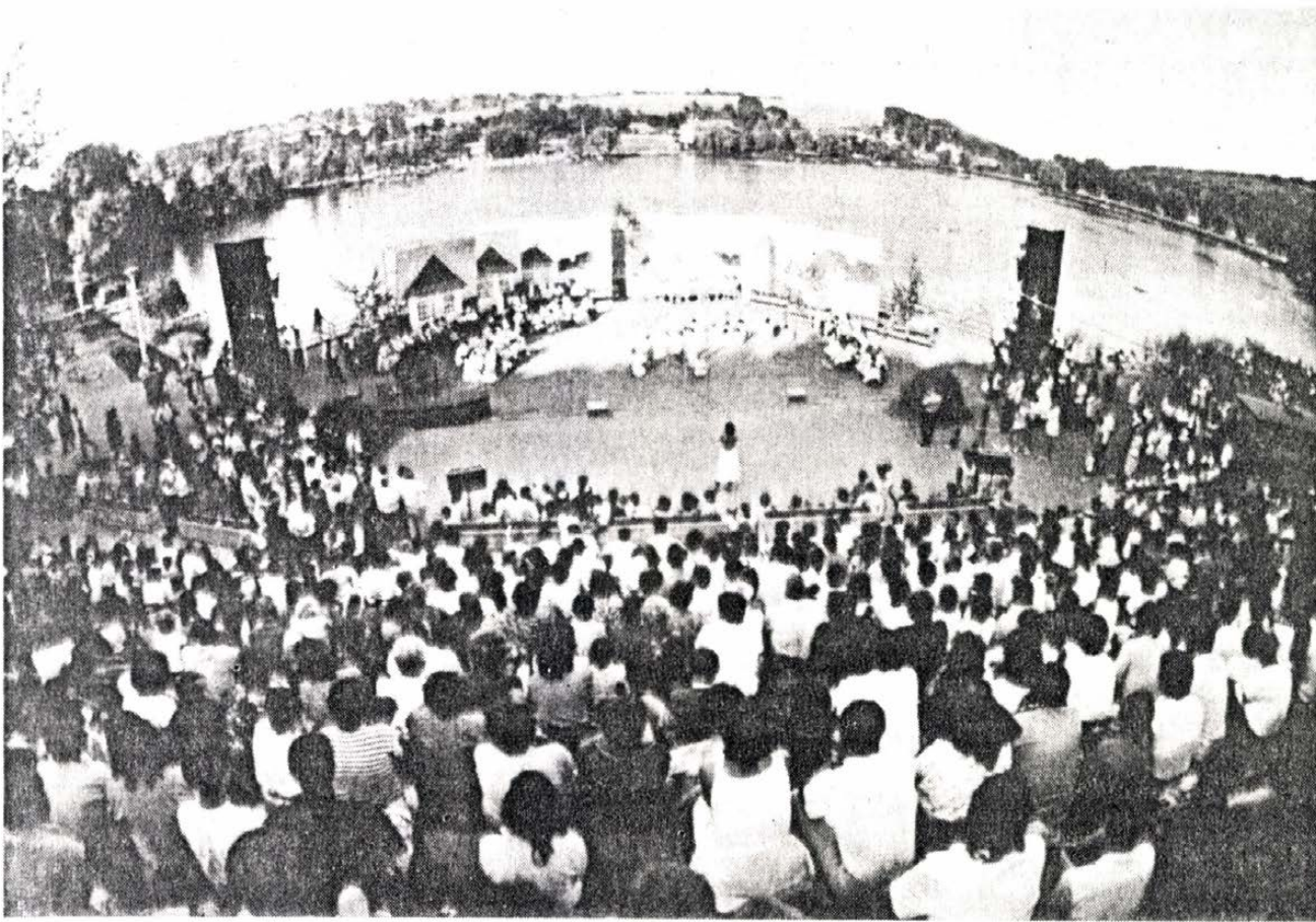
A banki viziszínpad a nemzetiségi találkozók hagyományos helyszíne