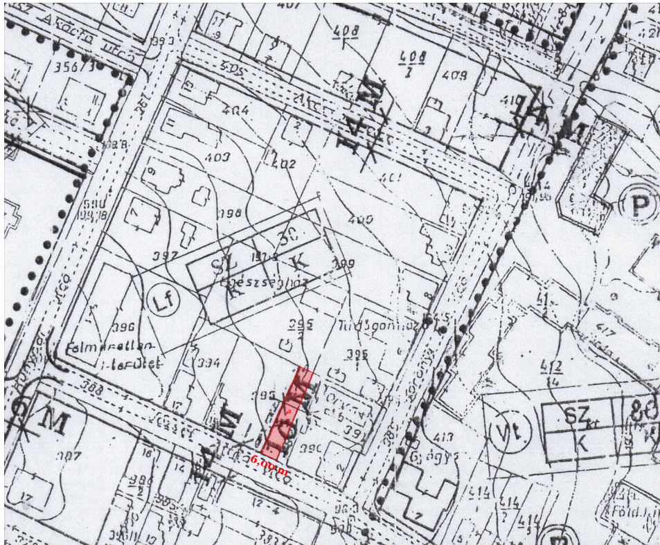
részlet a Belterületi Szabályozási Tervből

A 393. hrsz-ú ingatlan telkéből a 392. hrsz-ú bekötő út területének javára cca. 6,0 m szélességű telekrészt kiszabályoz (pirossal jelölve), hogy az így létrejött 10,0 m szabályozási szélességű közterület lehetővé tegye a 395/1 és 395/2 hrsz-ú ingatlanok megközelítését.