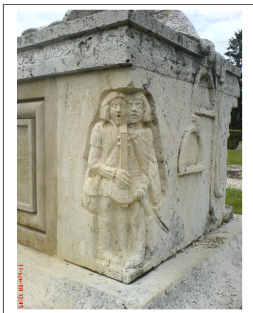
A két apród Kő Pál Szondi-szarkofágján (Dréghelypalánk)